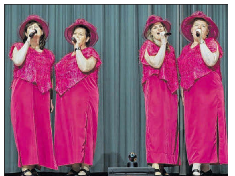
Ausgelassenes Damenquartett: Die „Schrillen Fehlaperlen“ beim Auftritt am Freitagabend im Kulturprogramm der SG Griesingen.

Am Freitagabend amüsierten sich die 350 Besucher prächtig: Die „Schrillen Fehlaperlen“ lieferten in ihrem aktuellen Programm „Liebe, Frust und Leberwurst“ mit Wortwitz, schrillum Outfit und derbschwäbischen Liedern einen wunderbaren Abend. Ausschweifend und in breitem Schwäbisch ging es in selbst getexteten Liedern um die Tücken des Alltags und die Not mit den Männern.