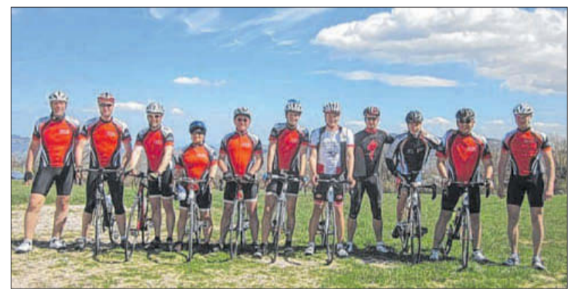
Die Mitglieder des RSC Ehingen im Trainingslager in Italien.

Ehingen. Die Radsaison kann starten: Elf Teilnehmer des Radsportclubs Phoenix Ehingen waren in Gatteo Mare in Italien im Trainingslager und haben sich, wie Stefan Enderle berichtet, mit täglichen Touren in zwei Leistungsgruppen viele Kilometer erkämpft. In der einen Woche haben die Freizeitfahrer in ihrer Gruppe zusammengenommen etwa 2500 Kilometer zurückgelegt, die sportlichen Fahrer kamen auch etwa 3500 Kilometer Gesamtleistung. Enderle freut sich: Somit wurde der Grundstein für eine weitere erfolgreich Radsaison gelegt.